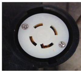
Extension 240V à fournir par le client